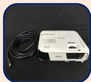
プロジェクター 500円